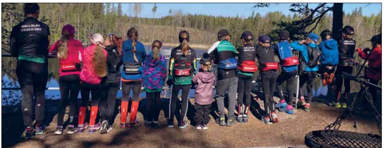
Kesällä harjoitellaan monipuolisesti mm. jalan ja rullasuksilla.