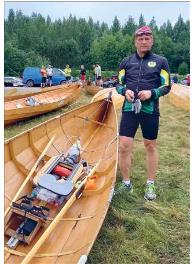
Vene ja mies valmiina Partalansaaren kiertoon v. 2022.