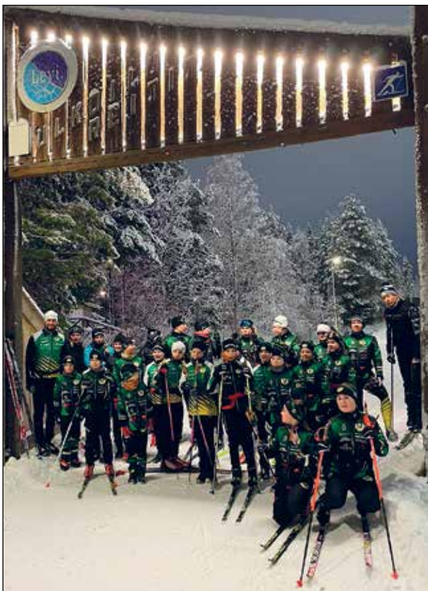
Levin lumileiri on muodostunut hiihtojaoston perinteeksi marras-joulukuun vaihteessa.