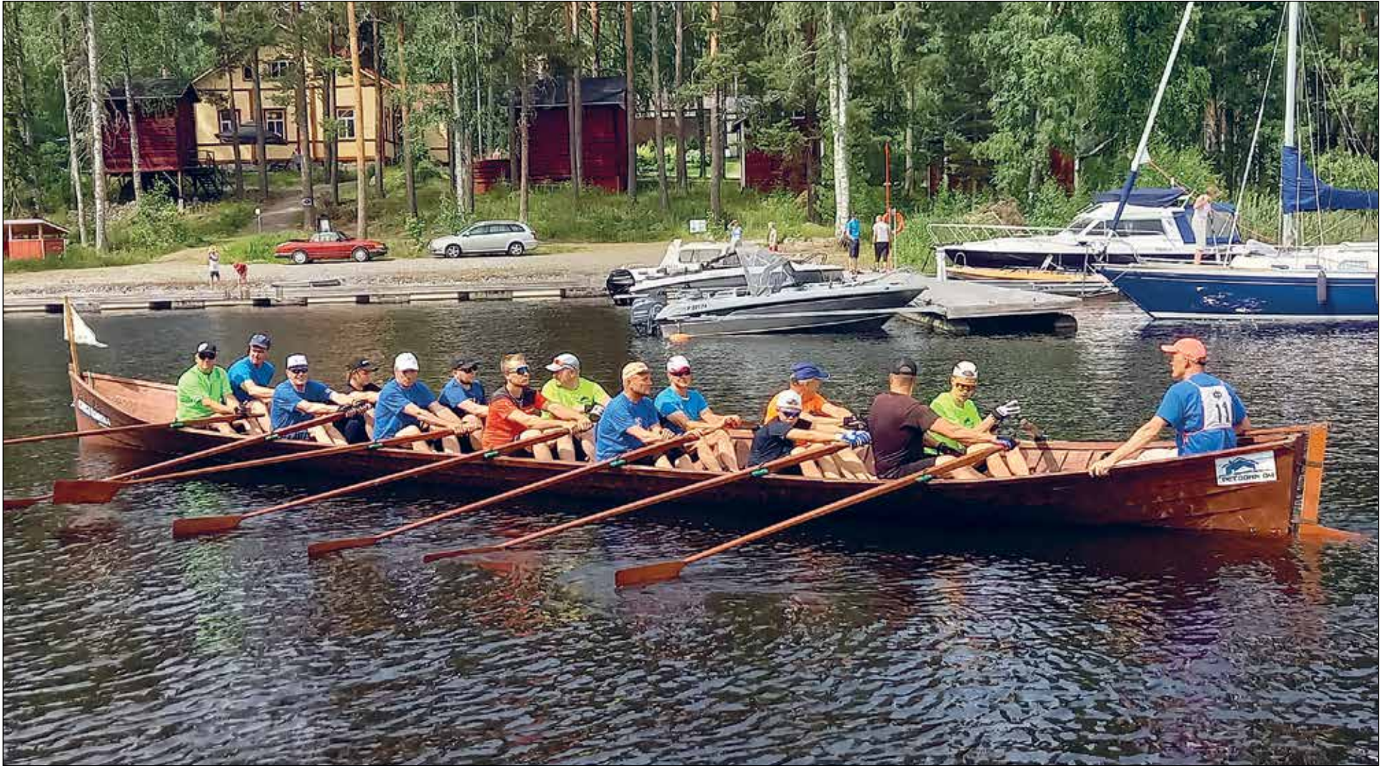
Sysmän soutu v. 2022.