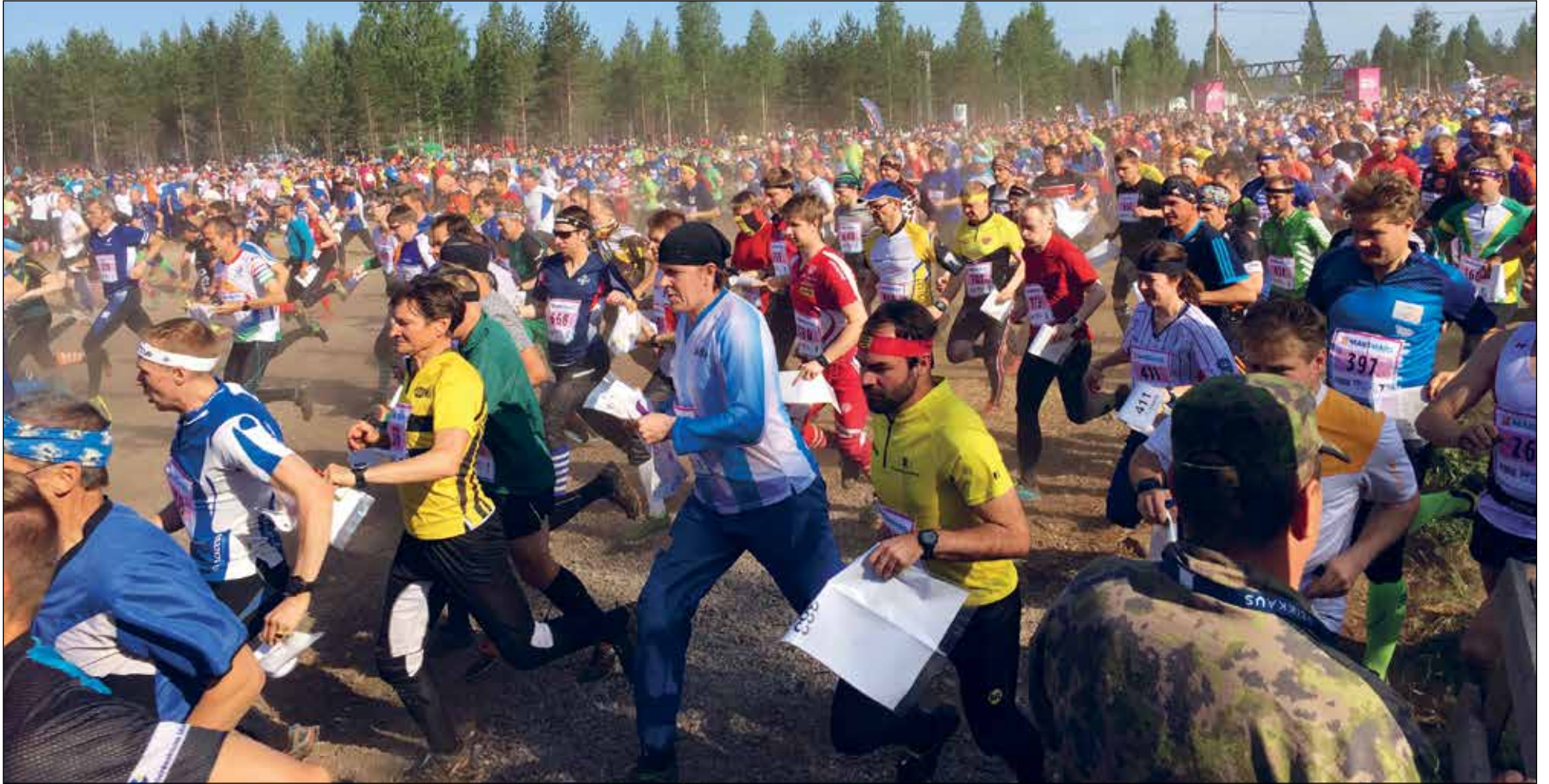
Tältä näytti kun Hälvälässä viimeksi juostiin viestiä. Silloin oli kyseessä Jukolan viesti mutta 10-9-2023 samalla paikalla suunnistetaan SM-viesti.