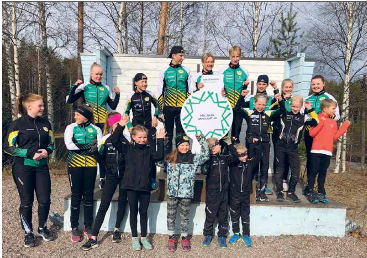
Nuoria kaikista ikäluokista keväällä 2021, kun hiihtojaostolle myönnettiin Olympiakomitean ja lajiliiton myöntämä Tähtimerkki lasten ja nuorten toiminnan osalta.